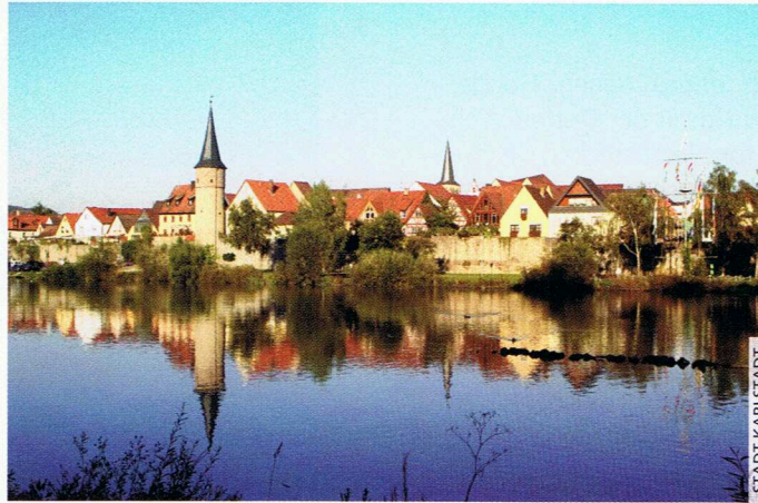
Als Investoren von Beteiligungsprojekten in erneuerbare Energien profitieren Städte, Kommunen und Stadtwerke genauso wie Bürger.